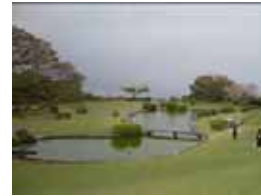
・華麗なる一族の万俵家の庭とあの池です