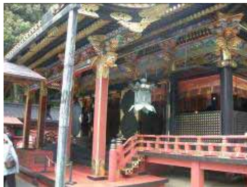
・やっぱり東照宮は色が派手です

今年度の全国大会「えひめ松山大会」のPR 気合入ってました。 最後にみんなで片を組んで「栄光の架橋」を熱唱して終わりました。静岡Y.E.G.の皆様ありがとうございました。