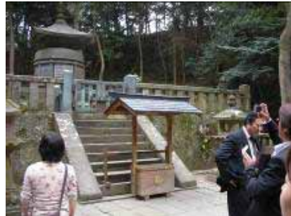
・家康の墓(日光ではないですよ)